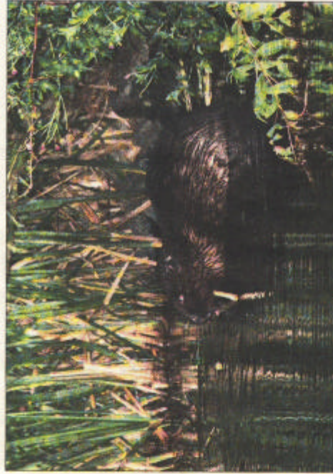
Rechts: Der Biber um 5 Uhr morgens vor der Dammbücke zwischen Großem und Kleinem Teich - im Dunklen aufgenommen mit starkem Blitz, der die Augen aufleuchten lässt. Links: Beim Untertauchen wölbt sich der breite Rücken.

die ersten störenden Bauversuche im Zuflussgraben durch die Mitarbeiter des Kurbetriebs mit Gittern vor dem Zuflussschacht verhindert wurden, ließ er es dabei bewenden. Vermutlich bereitet der Bad Nauheimer Biber wenig Probleme, weil die Lebensbedingungen im Großen Teich dank des artenreichen Uferstreifens und einem großen Wasserreservoir ideal sind.